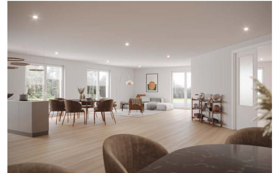
Die Wohnbereiche werden offen gestaltet.

ist es, einen Ambulanten Pflegedienst hier in Perleberg zu gründen. Es gab bereits erste Gespräche. Aber es wird die größte Herausforderung für uns sein, die Fachkräfte für unseren Pflegedienst zu finden.«