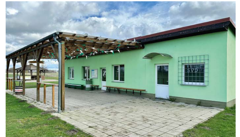
Das Sportlerheim des SV Dergenthin 1949 e. V.

Nun möchte Lotte den zukünftigen Dorfgemeinschaftsraum sehen. Und so geht es zurück ins Zentrum des Ortes zur alten Schule, gleich neben der Kirche. Apropos Kirche: Die ist noch gar nicht so alt, wurde 1920 geweiht.