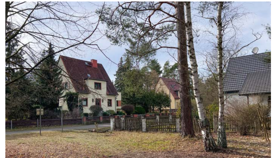
Blick in die Waldstraße mit ihren bewaldeten Grundstücken.

Und sie haben noch etwas, nämlich »Bartels Bier Bar«. Ende der 70er-Jahre eröffnete Konrad Bartels diese mittlerweile vielleicht etwas in die Jahre gekommene kultige Gastronomie, die sich als gern besuchtes Ausflugsziel einen Namen gemacht hat.