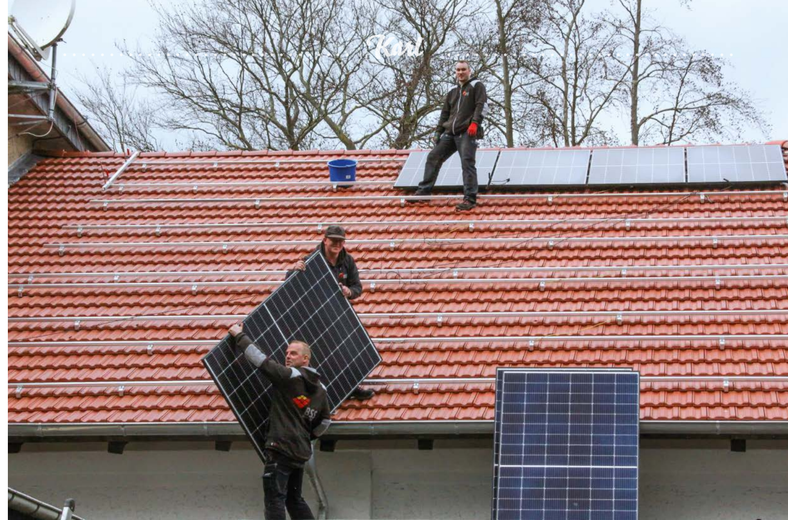
Die Handwerker der BSS stehen für das gesamte Leistungspaket aus einer Hand.