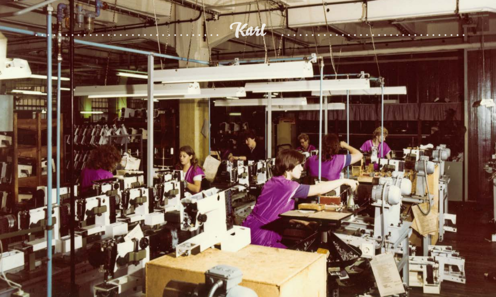
1983: Am Jugendband werden Veritas-Freiarmsnähmaschinen montiert.