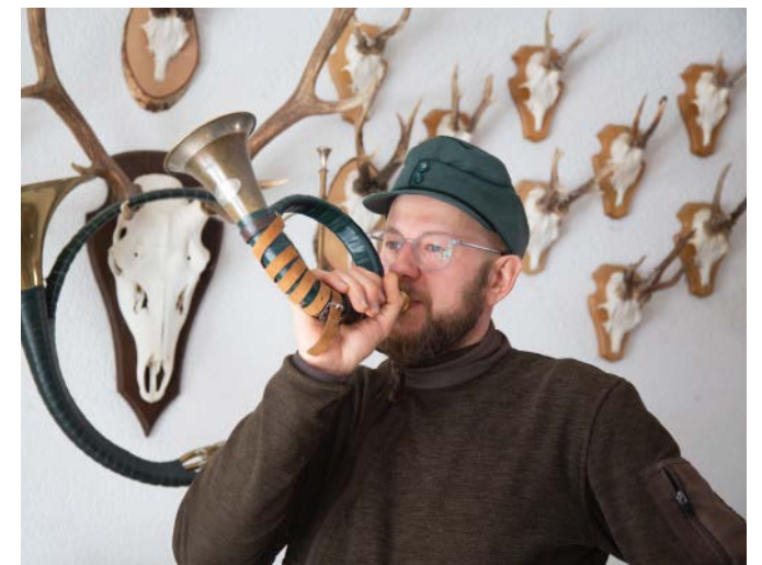
Halali, Aufbruch zur Jagd. Keine Jagd ohne die richtigen Signale.