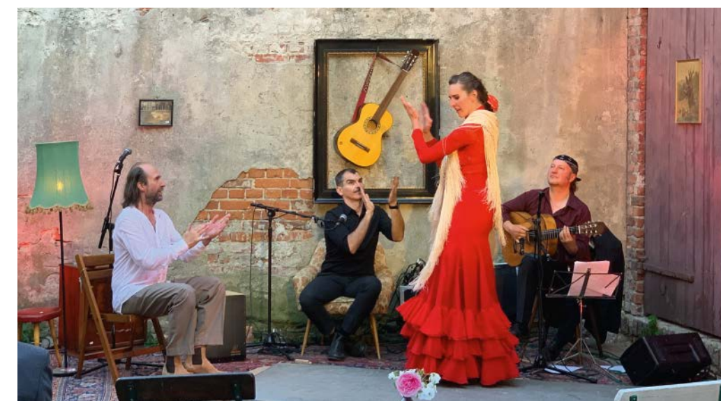
Das Flamencokollektiv aus Tackern bringt spanisches Lebensgefühl nach Perleberg.