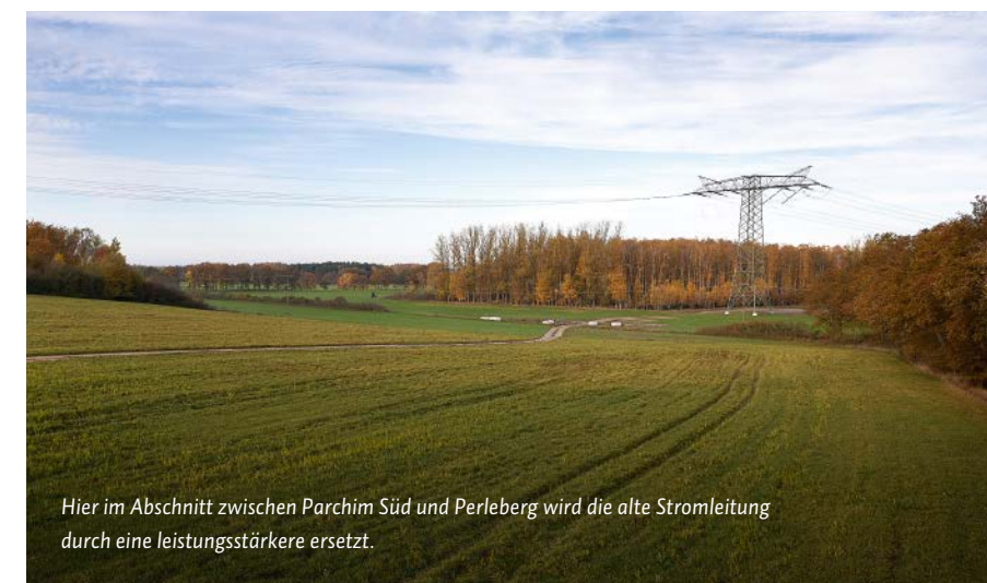
Hier im Abschnitt zwischen Parchim Süd und Perleberg wird die alte Stromleitung durch eine leistungsstärkere ersetzt.

Heidestraße 2 · 10557 Berlin Telefon 030 . 5 15 00 info@50hertz.com www.50hertz.com