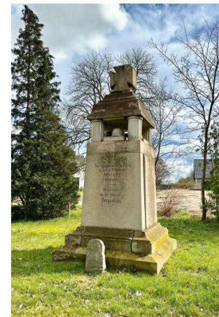
Das große Kriegerdenkmal erinnert an im 1. Weltkrieg gefallene Dergenthiner.

Lotte ist beeindruckt, was solch ein »kleiner« Ortsteil alles zu bieten hat und verabschiedet sich mit vielen schönen Eindrücken.