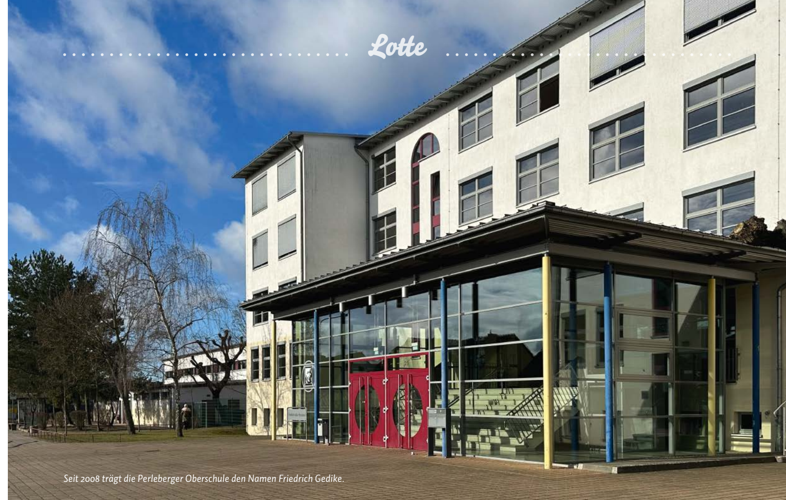
Seit 2008 trägt die Perleberger Oberschule den Namen Friedrich Gedike.