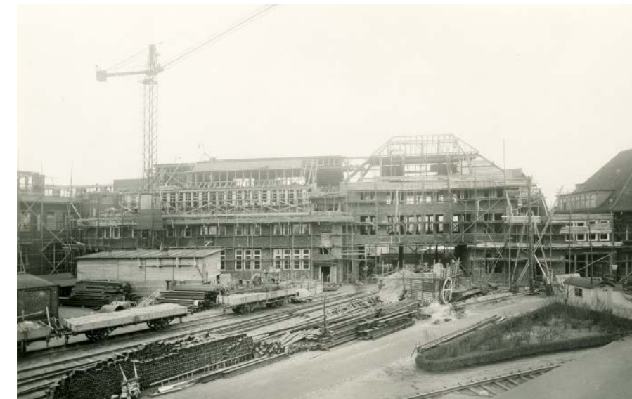
Bau des Verwaltungstraktes 1937, heute Sitz des Oberstufenzentrums.

In diesem Jahr gibt es zu 120 Jahre Grundsteinlegung keine Feier. Schließlich werden hier seit über 30 Jahren keine Nähmaschinen mehr hergestellt. Das Stadtmuseum und der Veritas-Klub erinnerten aber mit Veranstaltungen Anfang April auf dem Werks-gelände an das Ereignis. Von dort aus traten zwischen Produktionsbeginn im Mai 1904 und Liquidation 1991 über 14 Millionen Nähmaschinen den Weg in die Welt an. »Bei Singer und