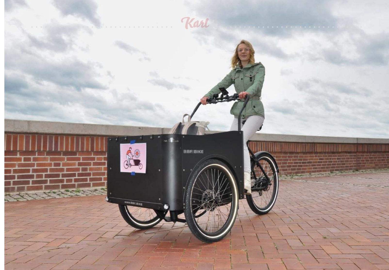
Mit dem »Elbkahn« lassen sich auch schwere Lasten bequem befördern.

unten: Der schmale »Hansdampf« schlängelt sich durch die engsten Gassen