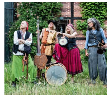
Satolstelamanderfanz ist in der uralten Tradition der fahrenden Spielleute unterwegs. Auf historischen Instrumenten spielen sie sowohl berückend schöne als auch kraftvoll-erdige Musik.