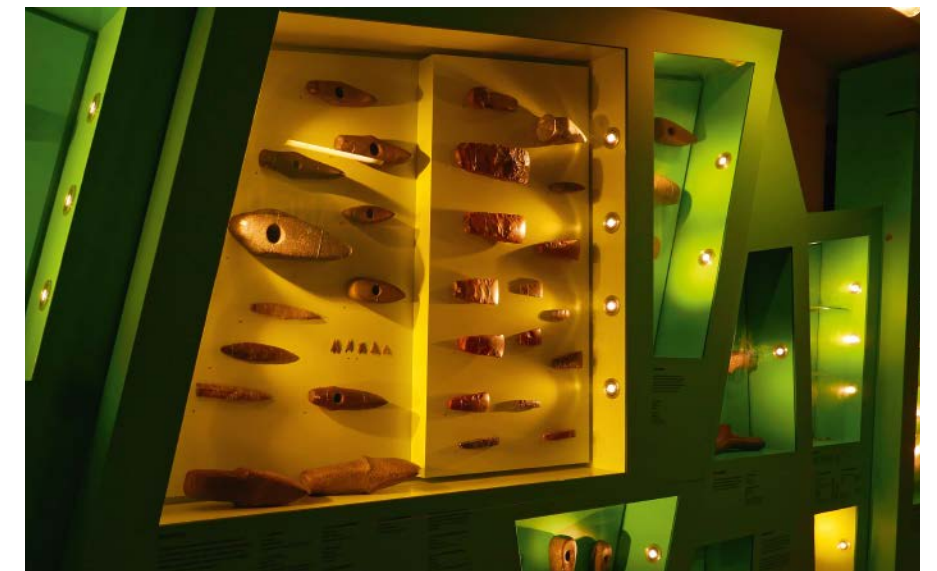
Die Mischung macht's – im Erdgeschoss sind weite Teile des Museums mit zeitgemäßen Vitrinen modern gestaltet, andere Räume lassen bewusst nostalgische Gefühle aufkommen.