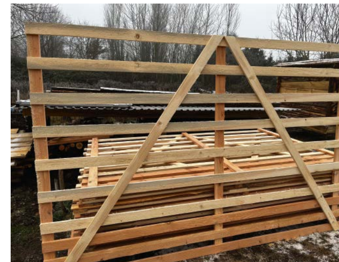
Nachhaltige Holzgatter schützen im Bundesforst vor Wildverbiss.