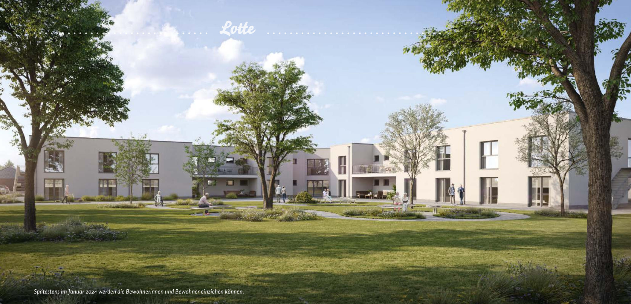
Spätestens im Januar 2024 werden die Bewohnerinnen und Bewohner einziehen können.

Lotte SCHAUT SICH IN DER QUITZOWER STRASSE UM