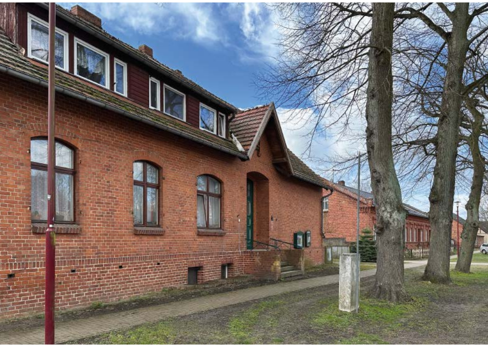
Die alte Schule bietet Platz für den neuen Dorfgemeinschaftsraum.

Mitglied im Gemeindegemeinderat, erwartet er Lotte im Gerätehaus der Freiwilligen Feuerwehr.